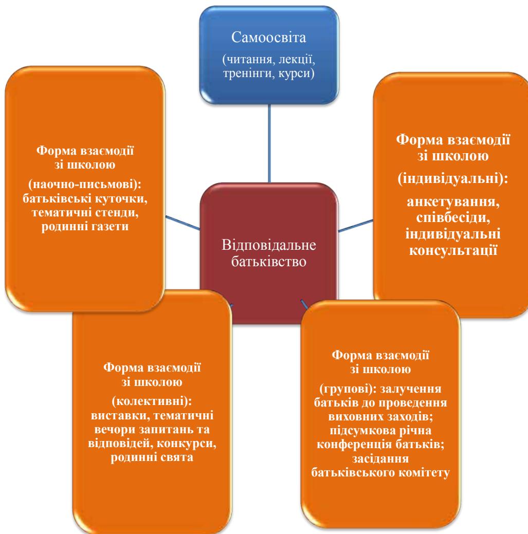
Рис. 4. Форми взаємодії зі школою сім'ї

4 гр. Методи самовиховання «своє під носом, а чуже під лісом» (самопізнання, самостановлення, саморегуляція).