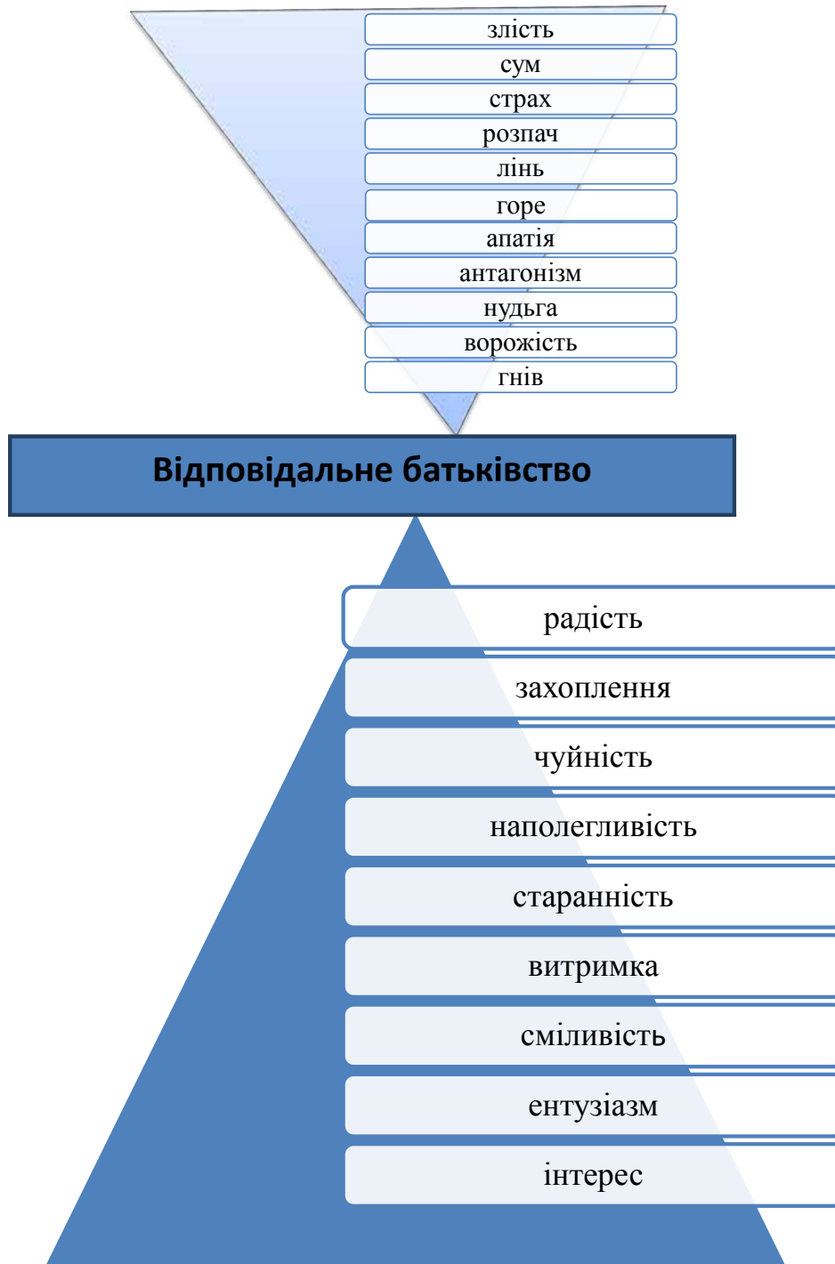
Рис. 2. Піраміда емоцій та відповідальне батьківство

Також набирає сили тенденція гармонійного поєднання інтересів учасників виховного процесу: вихованця, котрий прагне до вільного саморозвитку і збереження своєї індивідуальності; суспільства, зусилля якого спрямовуються на всебіч-