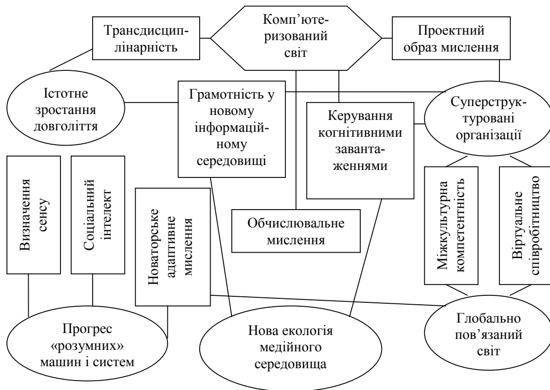
Рис. 1. Карта професійних навичок майбутнього:

Для отримання фахівців нової формації, які потрібні пенітенціарній системі України, необхідно інноваційно змінювати методологію навчання, що повинна базуватися на певних положеннях теорії пізнання та діяльності, сучасних дидактичних теорій і технологій навчання, наявної методології навчання й освітньої діяльності у вищій освіті, в яких відображено розуміння цілісності змісту освіти й педагогічного, освітнього процесів; розуміння структури і змісту освіти з погляду освітнього