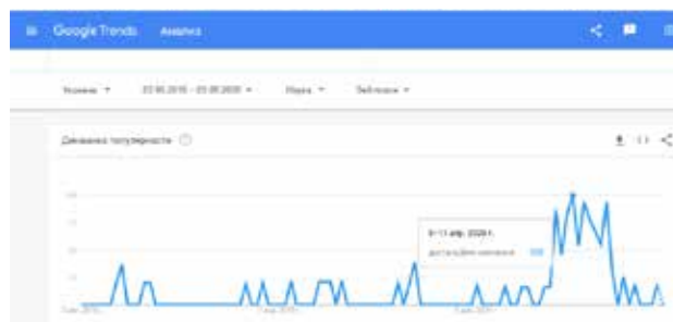
Рис. 3. Динаміка популярності запиту «дистанційне навчання» із 02 серпня 2018 по 02 серпня 2020 рр. (5–11 квітня 2020 р.) [2]

Найбільш популярним запит (100%) стає з 05 по 11 квітня 2020 р. (рис. 3). І це зрозуміло, тому що саме в цей період в Україні було запроваджено надзвичайну ситуацію та продовжено карантин [19]. Міністерство освіти і науки України 02 квітня 2020 р. дало офіційне роз'яснення, що структуру та форми навчання у школі на час карантину визначає педагогічна рада закладу освіти [18].