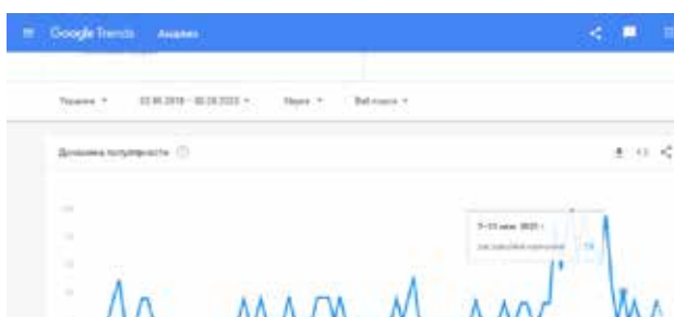
Рис. 5. Динаміка популярності запиту «дистанційне навчання» із 02 серпня 2018 по 02 серпня 2020 рр. (7 червня 2020 р.) [2]

Як видно з графіку (рис. 5), у період із 07 червня 2020 р. дотепер (01 серпня 2020 р.) рівень популярності запиту не перевищує 26%.