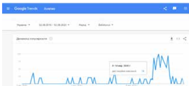
Рис. 1. Динаміка популярності запиту «дистанційне навчання» із 02 серпня 2018 по 02 серпня 2020 рр. [2]

Отже, за даними сервісу Google Trends (рис. 1) динаміка популярності веб-пошуку запиту «дистанційне навчання» в Україні у період із 02 серпня 2018 по 02 серпня 2020 рр. (категорія «Наука») не є однорідним [2]. Із серпня по грудень 2018 р. популярність теми не перевищує 37%, а у 2019 – 39%. Найбільш трендовим по Україні запит став у період із 15 березня по 23 травня 2020 р. Це можна пов'язати із загальнонаціональною ситуацією, яка склалася тоді в Україні.