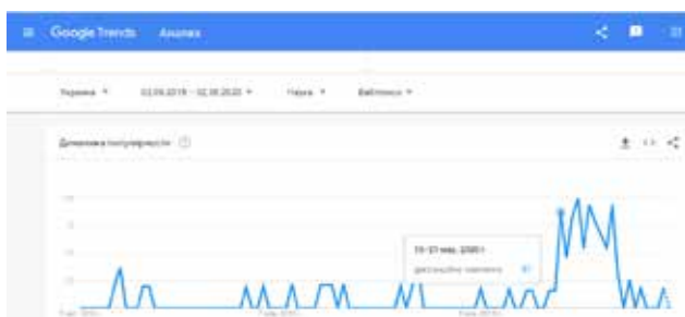
Рис. 2. Динаміка популярності запиту «дистанційне навчання» із 02 серпня 2018 по 02 серпня 2020 рр. (період з 23 по 25 березня 2020 р.) [2]

Із 15 по 21 березня динаміка популярності досягає вже 87% (рис. 2). У період із 23 по 25 березня 2020 р. МОН публікує ряд листів щодо організації освітнього процесу під час карантину [20–23]. Починається «гаряча пора» впровадження дистанційного навчання в українській освітній процес.