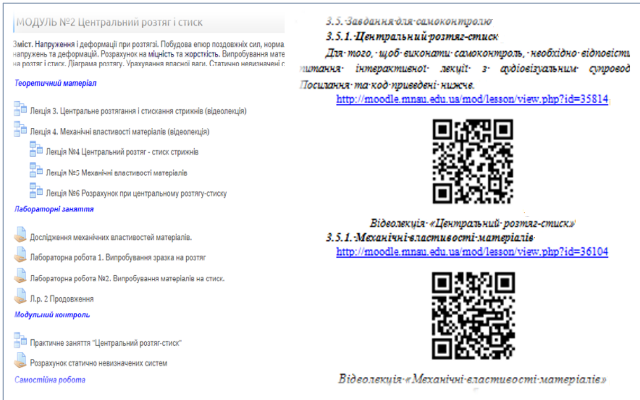
Рис. 4. Загальний вигляд теми «Центральне розтягання та стискання» із дисципліни «Механіка матеріалів і конструкцій» в умовах цифрового середовища закладу вищої освіти та в навчальному посібнику із використанням зазначеного середовища

оцінку для здобувачів вищої освіти та статистичні показники щодо виконання завдання для викладача. Таким чином, для здобувачів вищої освіти формується рейтинг під час навчання в умовах цифрового середовища закладу вищої освіти, який впливає на підсумкову оцінку. У зазначеному середовищі майбутні інженери можуть як навчатися в аудиторії, так і виконувати роботу самостійно. Викладач контролює час проходження певних завдань та встановлює часові обмеження та обмеження та кількість спроб, аналізує результати здобувачів вищої освіти за допомогою журналу оцінок та статистичних показників [12].