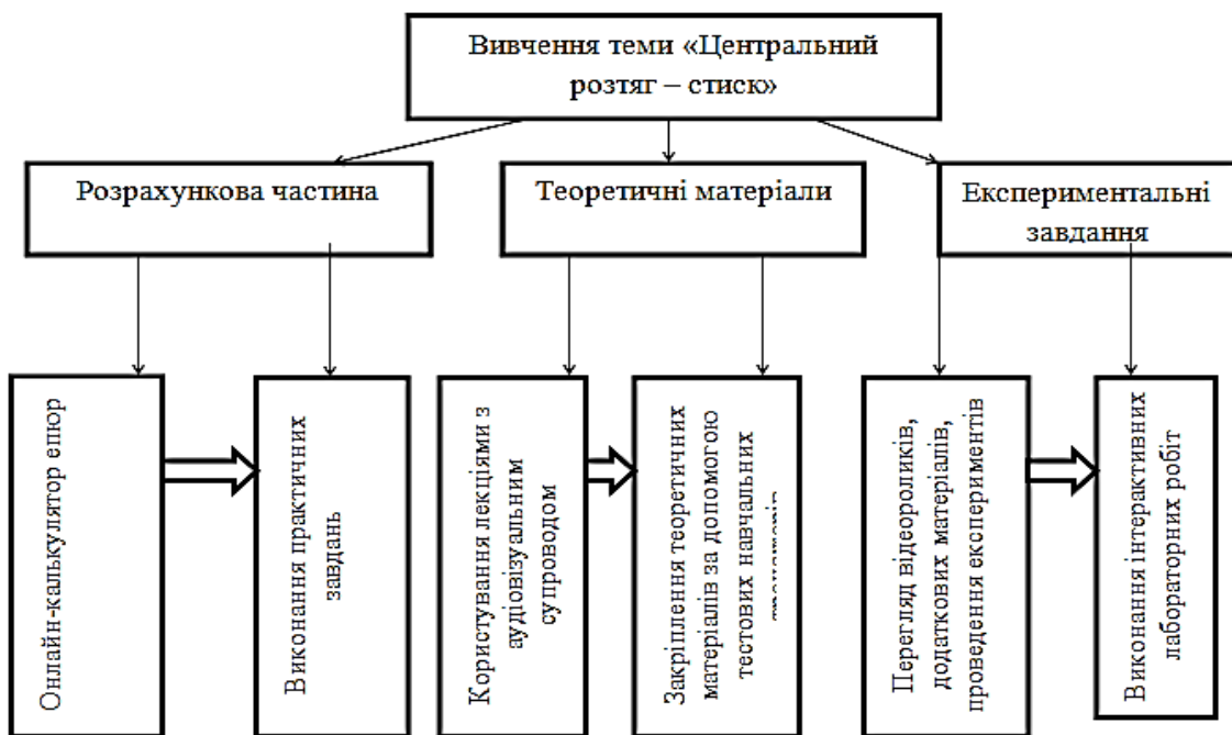
Рис. 3. Схема вивчення теми «Центральне розтягання та стискання» із дисципліни «Механіка матеріалів і конструкцій» в умовах цифрового середовища закладу вищої освіти