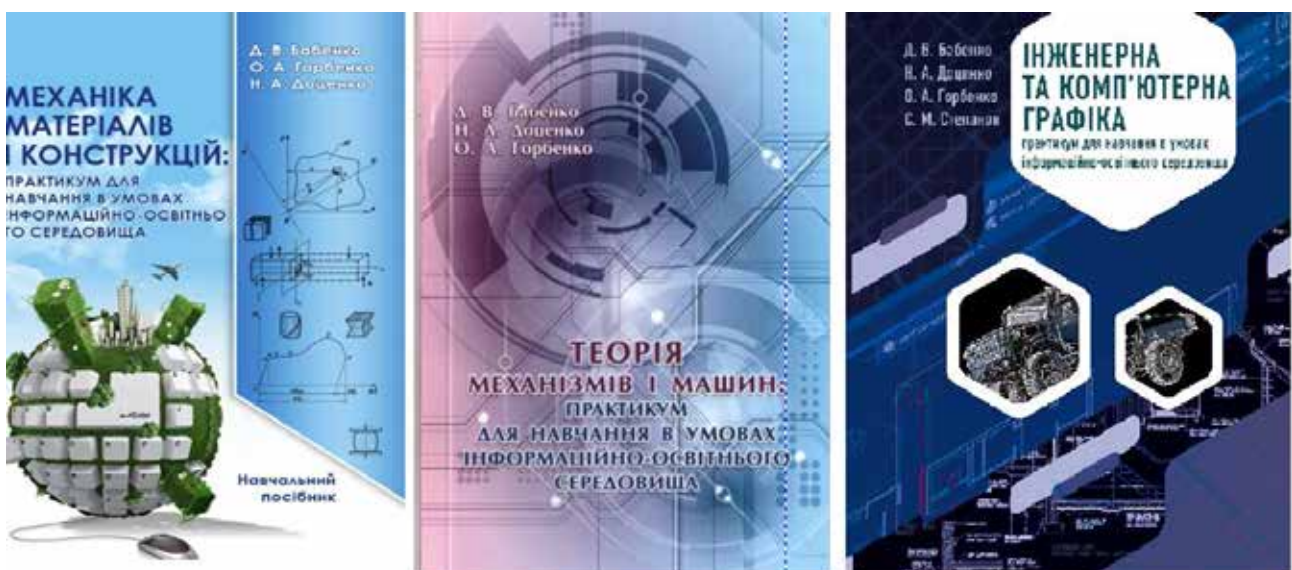
Рис. 1. Навчальні посібники із загальнотехнічних дисциплін в умовах цифрового середовища закладу вищої освіти

Для викладання загальнотехнічних дисциплін в умовах цифрового середовища закладу вищої освіти було розроблено методичку та видано низку навчальних посібників із загальнотехнічних дисциплін (практикуми для навчання в умовах інформаційно-освітнього середовища з дисциплін «Механіка матеріалів і конструкцій», «Теорія механізмів і машин», «Інженерна та комп'ютерна графіка») [9–11], роботу за якими було апробовано зі здобувачами вищої освіти спеціальностей 208 «Агро-