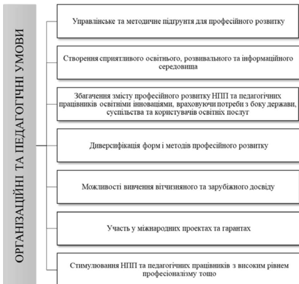
Рис. 3. Умови забезпечення успішного функціонування системи професійного розвитку НПП і педагогічних працівників у НФаУ