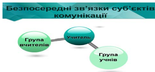
Рис. 2. Безпосередні зв'язки суб'єктів комунікації

Професійно-педагогічна комунікація реалізується як система найрізноманітніших безпосередніх та опосередкованих зв'язків суб'єктів комунікацій (див. рис. 2).