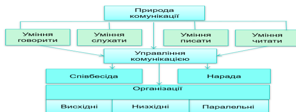
Рис. 1. Природа комунікації

Таким чином, для ефективної комунікації керівникам закладів освіти необхідно усвідомити свої персональні навички, свою здатність керувати процесом комунікації в групах, а також свою ефективність у відстеженні висхідних, низхідних і паралельних потоків інформації та ідей всередині організації, охоплюючи, зрозуміло, взаємодію організації з освітянами.