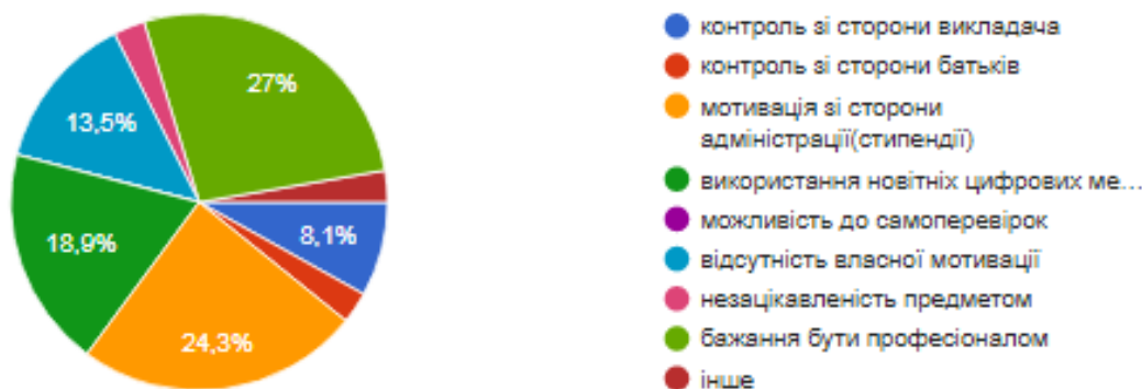
Рис. 3. Діаграма відповідей студентів 4 курсів

На відміну від студентів 1 курсу, студенти 4 курсу на 1 місце поставили бажання бути професіоналом, 2 та 3 місця розділили мотивація зі сторони адміністрації та використання цифрових методів.