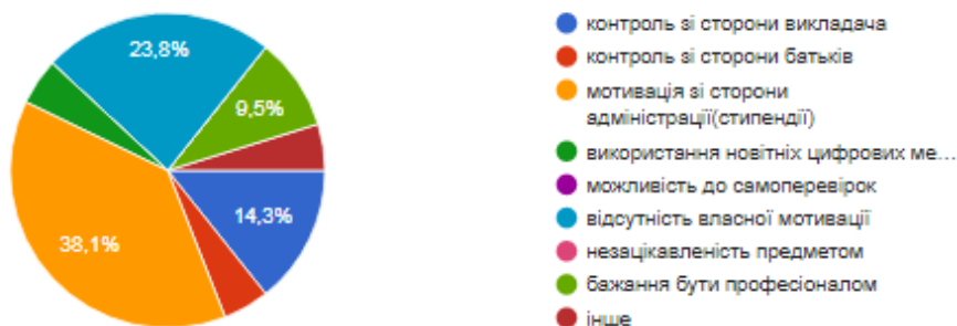
Рис. 2. Діаграма відповідей студентів 1 курсів

Більшість зумерів мають зовсім нереалістичні очікування щодо того, чого вони можуть досягти за допомогою своїх інвестицій і вони добре обізнані в основних фінансових концепціях. Можливо тому такий великий відсоток зайняв саме фактор – мотивація зі сторони адміністрації (рис. 2).