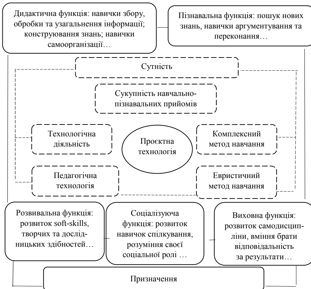
Рис. 1. Сутність та призначення проєктних технологій

– «це загальноприйнятий термін для різних інтернет-додатків, які дозволяють користувачам створювати контент та взаємодіяти один з одним» [8].