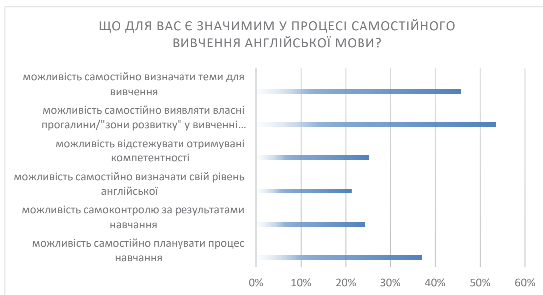
Рис. 1. Узагальнені результати опитування здобувачів щодо чинників, які є для них важливими під час самостійного опанування ІМ

Розглянемо структурні компоненти ЄМП відповідно до Загальноєвропейських рекомендацій з мовної освіти [1]. ЄМП повинен складатися з трьох розділів: Мовний Паспорт (Language passport), Мовна Біографія (Language Biography) та Досьє (Dossier). Така структура дозволяє відобразити актуальний рівень володіння ІМ власника