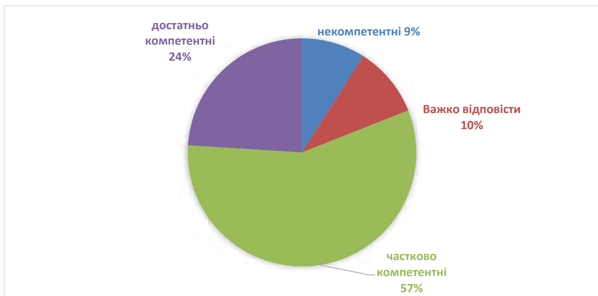
Рис. 1. Розуміння майбутніми педагогами сутності рефлексії та її значення у педагогічній діяльності

Порівнюючи показники визначення рівня рефлексивності студентів з 1-го по 4-й курс, ми спостерігаємо динаміку за шкалою, що відповідає низькому рівню розвитку рефлексивної компетентності: 72% студентів, які навчаються на 1-му курсі, та 20% студентів, які навчаються на 4-му курсі, що дозволяє нам говорити про позитивну динаміку у студентів, які під час проходження практики підвищують рівень рефлексивної компетентності.