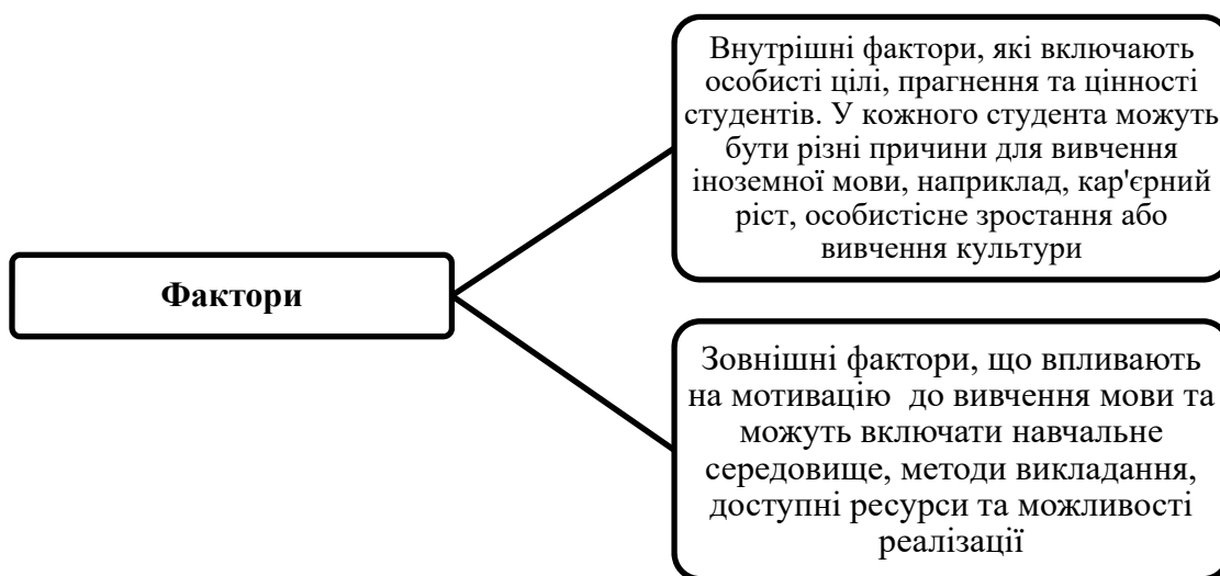
Рис. 1. Фактори, які впливають на мотивацію до вивчення іноземної мови [5]

Рідель Т. М. вважає, що мотивацією у вивченні іноземної мови є організація навчальної діяльності, спрямованої на досягнення більш глибокого розуміння мови та її вдосконалення, а також культивування внутрішнього прагнення до її вивчення та осмислення [2, с. 448–453]. Тимошук Н. М. підкреслює, що мотивація слугує рушійною силою, яка спонукає людину до успішного оволодіння іноземною мовою. Проте надмірно високий рівень мотивації може викликати небажані (негативні) емоції та перешкоджати успішності студентів у вивченні предмета. Важливим є дотримання балансу, щоб вивчення іноземної мови викликало у студентів неабияке бажання оволодіти нею, приносило радість і задоволення від отриманих результатів [3]. Враховуючи тему дослідження, найбільш доцільним, на нашу думку, є визначення Малінки О., відповідно до якого мотивація визначається як цілісна система мотивів, що спрямовують