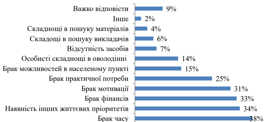
Рис. 4. Фактори, які стримують вивчення іноземних мов, %