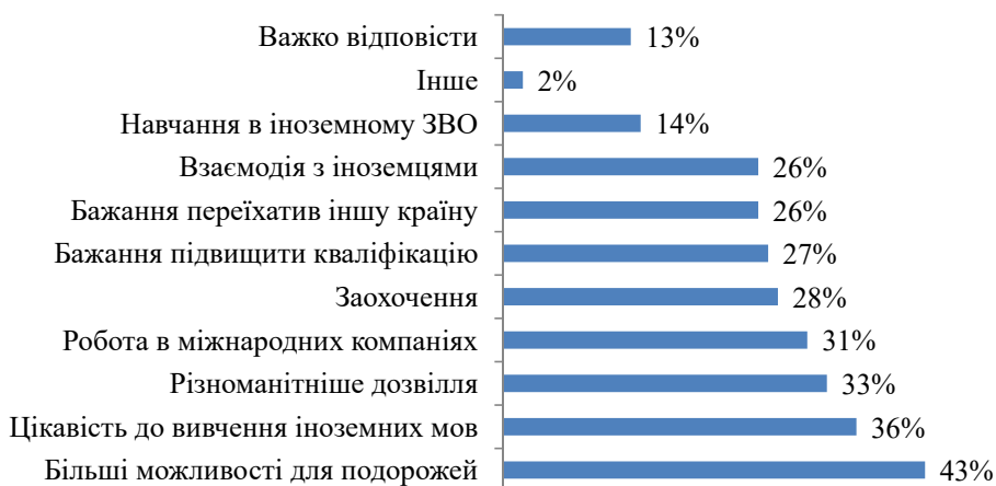
Рис. 3. Внутрішні та зовнішні фактори, що впливають на мотивацію до вивчення іноземної мови, % [9]

Для покращення показників володіння іноземними мовами, які продемонструвало дослідження,