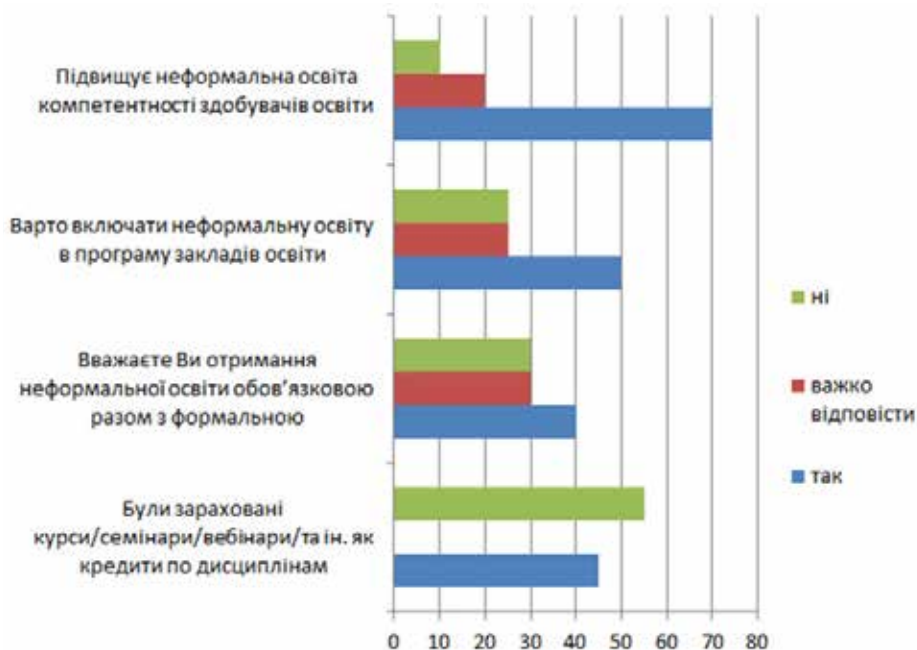
Рис. 2. Відповіді респондентів

Висновки та пропозиції. Українська освіта розвивається в контексті європейських освітніх тенденцій, переймає кращий європейський досвід, а неформальна освіта в Європі має своє вагоме