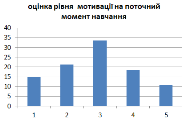
Рис. 1. Оцінка рівня мотивації здобувачами освіти на поточний момент навчання

Перший блок дослідження містив питання щодо оцінки рівня своєї мотивації на поточний момент навчання. Рівень необхідно було визначити по шкалі Лайкерта, яка часто використовується в анкетах і анкетних дослідженнях (де 1 бал – дуже низький рівень, 5 балів – дуже високий рівень) (рис. 1).