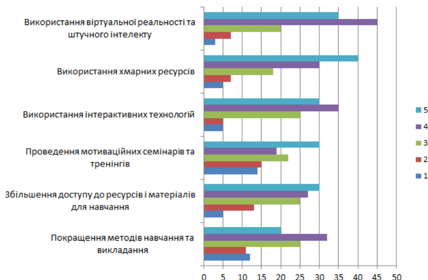
Рис. 3. Відповіді здобувачів освіти

Тобто, застосування в освітньому процесі при підготовці майбутніх фахівців готельно-ресторанної справи інформаційних технологій та інтерактивних платформ є необхідним та підвищує мотивацію, про що свідчать результати дослідження. Цифрова освіта допомагає створити умови для отримання необхідних знань та навичок, а також сприяє розвитку творчості та критичного мислення у студентів.