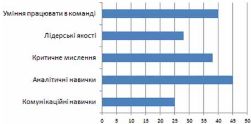
Рис. 1. Відповіді респондентів

• Лідерські якості – 28%. Здатність бути лідером у групових проектах або діяльності, координувати дії команди, стимулювати співпрацю та досягати спільних цілей.