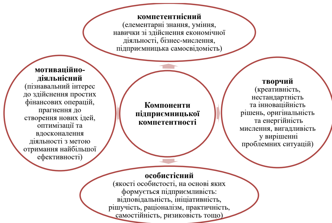
Рис. 1. Структура підприємницької компетентності молодшого школяра

Структура підприємницької компетентності молодшого школяра визначає її зміст та про- відну мету. Так, основні завдання формування підприємницької компетентності учнів почат- кової школи полягають у: розвитку базових знань, умінь та навичок про сучасний еконо- мічний світ, взаємозв'язки у ньому, принципи