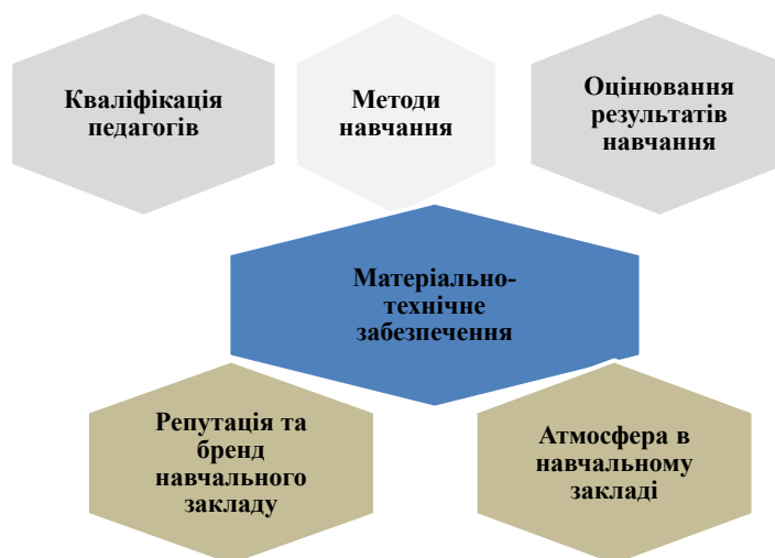
Рис. 2. Складові якісної освіти

Вчитель – це провідник знань. Кваліфікований вчитель не лише передає знання, але й формує особистість учня, розвиває його критичне мислення, творчі здібності, соціальні навички. Кожен вчитель при викладанні свого предмету повинен