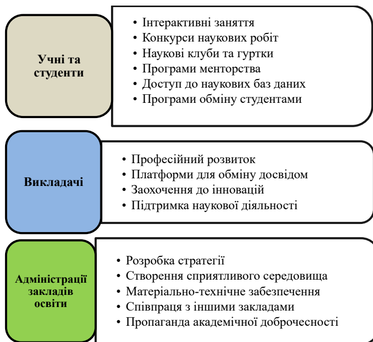
Рис. 3. Заходи з поширення та популяризації академічної доброчесності в Україні

Також необхідно співпрацювати з громадськими організаціями, які займаються розвитком освіти та науки. Активно використовувати сучасні технології для навчання та досліджень.