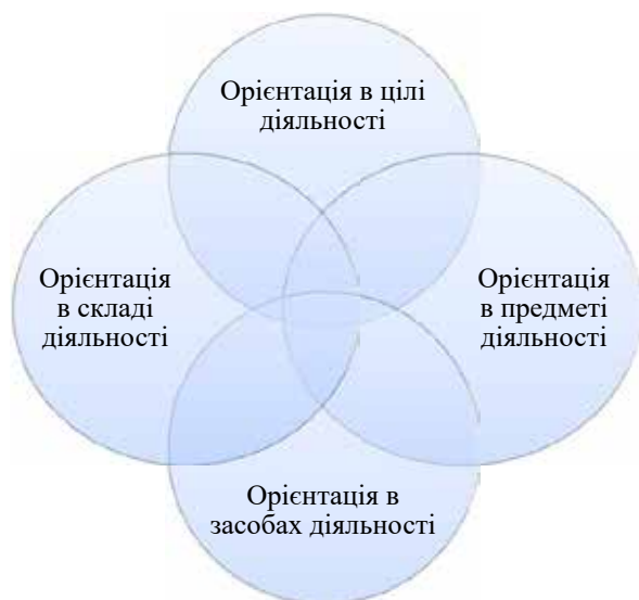
Рис. 1. Вимоги до професійної підготовки майбутніх психологів

підготовки майбутніх психологів – формування спеціальних умінь знаходити своєрідні вирішення проблем.